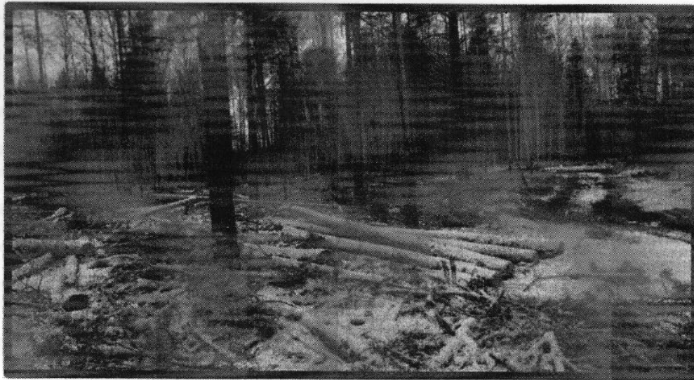
Изображение N 7

Брошенная древесина вдоль лесовозных дорог. Не является валежником