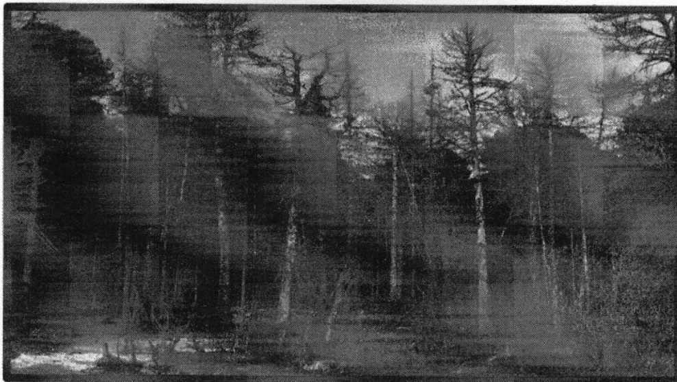
Изображение N 5

Кроме того, необходимо обратить внимание, что деревья, которые лежат на земле, но не имеют признаков естественного отмирания (имеют зеленую листву или хвою), определять как "мертвые" не