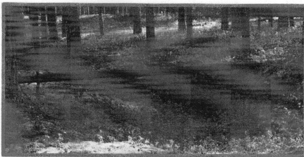
Изображение N 3