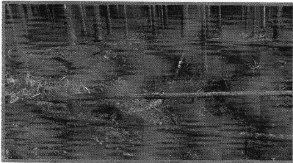
Изображение N 2